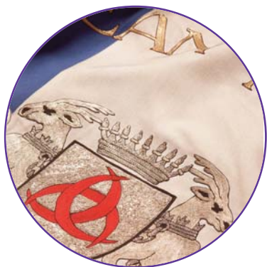
Détail de broderie

Par respect, le drapeau d'un État ne devrait jamais flotter la nuit, sauf s'il est bien éclairé.